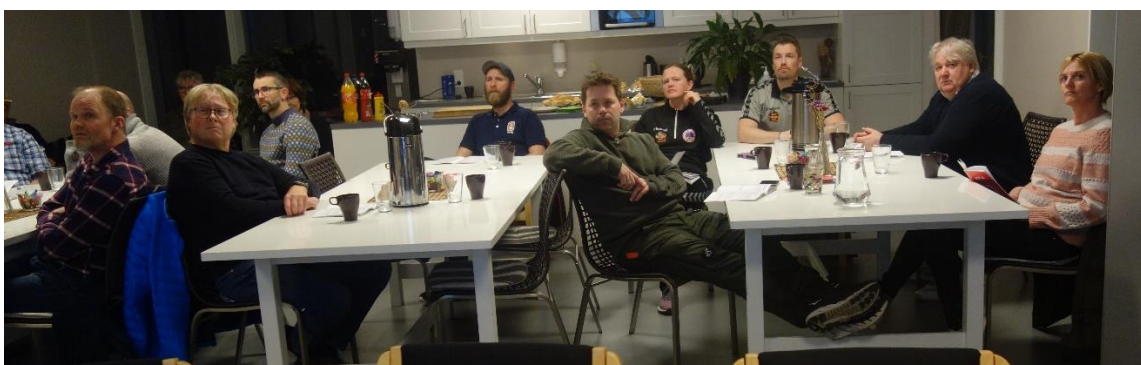
En lydhør forsamling på 20 personer fulgte spent med på hallpresentasjonen.